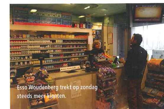
Esso Woudberg trekt op zondag steeds meer klanten.