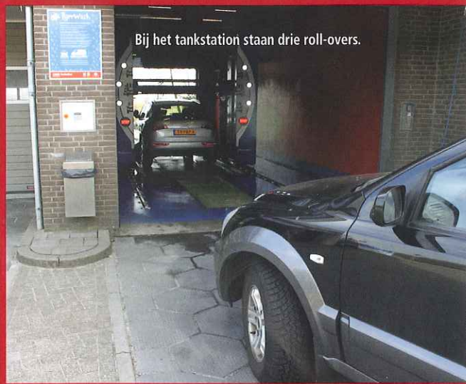
Bij het tankstation staan drie roll-overs.

binden. Onder meer door de laagdrempeligheid, komen bedrijven uit de regio naar ons toe. Binnen een week is het bijvoorbeeld geregeld, we vragen geen borg en de kosten worden per liter verrekend. Ik zie dat voor wat betreft de vlotte afhandeling en de zakelijke band die we met onze klanten opbouwen nog niet gebeuren met een hoofdkantoor dat op afstand de zaken regelt voor een onbemand station.”